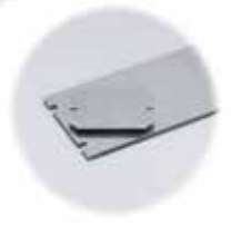
Asennuslevyt (galvanoitu teräs, levyn vahvuus 1,5 mm)

CAD-tiedostot, pdf-tuotekortit ja mittapiirrokset ladattavissa www.fibox.fi