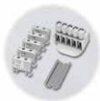
Liitin ja adapteri / DIN-kiskosarja