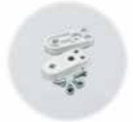
Seinäkiinnike (2 kpl) sis. ruuvit FP 10674