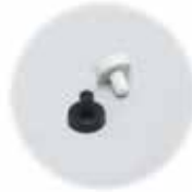
Sinetöintitulppasarja (40 kpl) DPS 14553 (harmaa kansi) DPS 14553B (läpinäkyvä kirkas kansi)