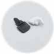
Siipivääninsarja (40 kpl) MBS 14552 (harmaa kansi) MBS 14552 B (läpinäkyvä kirkas kansi)