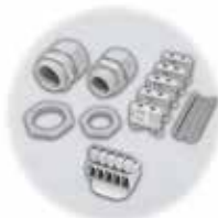
Holkkitiiviste, liitin ja adapteri /DIN-kiskosarja